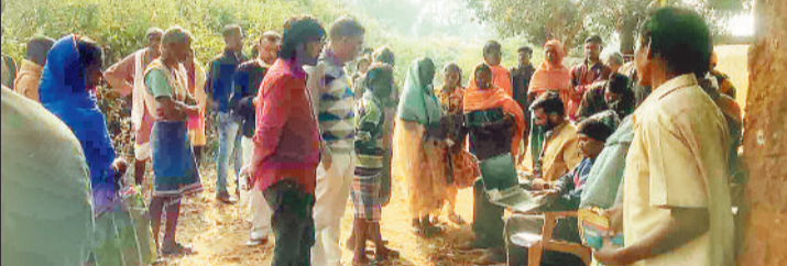
हरिभूमि न्यूज >>> अंबिकापुर।

शिक्षा जीवन का आधार है और यदि कोई व्यक्ति शिक्षित हो जाए तो उसके जीवन स्तर में परिवर्तन आ जाता है। यही वजह है कि शिक्षा को हमारे सभ्य समाज में सबसे बड़ा स्थान दिया गया है। बदलाव आया है इसके साथ ही अब अब उनसे जुड़े समाज के लोगों का जीवन स्तर भी मिलती है इसका जीता जागता उद्वारण सरगुजा जिले में निवास करने वाले पहाड़ी