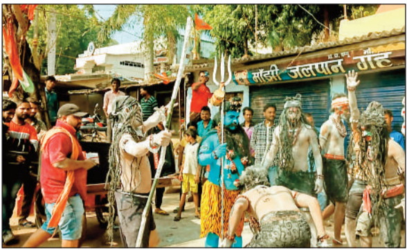
प्रतियोगिता में शामिल कलाकार।

सांस्कृतिक मंच का अनूठा आयोजन विदा वर्ष को यादगार बनाने मनेन्द्रगढ़ में उतरा बहुरूपियों का संसार