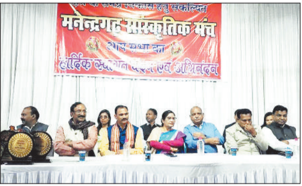
बहुरूपिया प्रतियोगिता में उपस्थित मंत्री सहित अन्य।