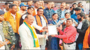
हरिभूमि न्यूज >>> पोड़ीमोड़