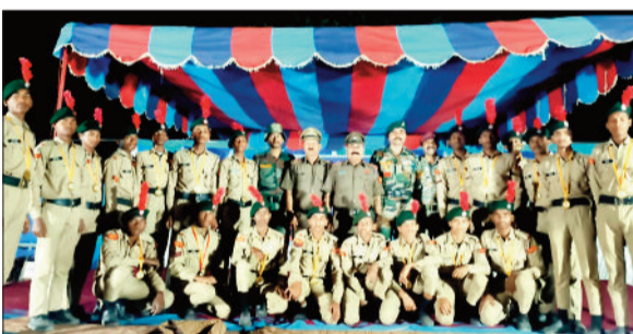
प्रशिक्षण में शामिल कैडेट्स एवं अधिकारी।