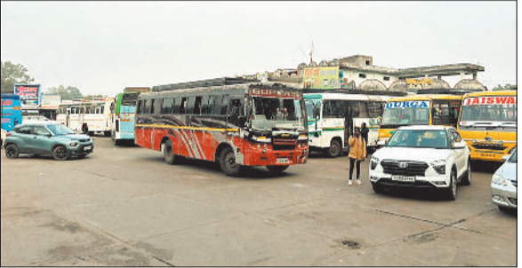
प्रतीक्षा बस स्टैंड में खड़ी वाहन।