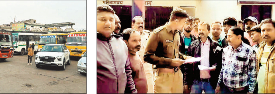
थाने में ज्ञापन सौंपने गए ड्राइवर।

कोरिया और एमसीबी जिले में ड्राइवरो की हड़ताल का व्यापक असर देखने को मिला। जिला मुख्यालय बैकुंठपुर सहित मनेन्द्रगढ़, चिरमिरी, खड़गवां, जनकपुर, भरतपुर, कोटाडोल, पटना, पंडोपारा सहित अन्य जगहों से चलने वाली यात्री बसों के पहिए थमे रहे। कोरिया और एमसीबी जिले में साल के पहले दिन सोमवार को हाहाकार मच गया, क्योंकि साल की परेशानियों को सामना करना पड़ा, इसके अलावा बड़ी संख्या में निजी वाहन चालक भी इस हड़ताल में शामिल हैं। ऐसे में जिले के ज्यादातर पेट्रोल पंप में तेल की सप्लाई नहीं हो