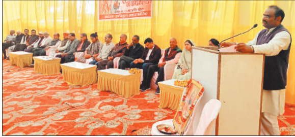
ब्राह्मण समाज की बैठक में उपस्थित अतिथि।

देव भगवान परशुराम जी के छायाचित्र पर समाज के वरिष्ठजन ने माल्यार्पण व दीप प्रज्वलित कर किया गया, इसके बाद मंच पर उपस्थित समाज के वरिष्ठ सदस्यों ने समाज सुधार की दिशा में अनेक बातें कहीं। इस अवसर पर समाज में फैली अनेक कुरीतियों को दूर करने के बारे में भी चर्चा की गई और तमाम कुरीतियों से सामाजिक जन को दूर रखने के लिए ठोस कदम उठाने पर चर्चा की गई। सामाजिक जन ने समाज की एकता पर बल दिया और कहा कि आज समाज के लोग हर क्षेत्र में एक महत्वपूर्ण भूमिका निभा रहे हैं। ब्राह्मण समाज का प्रत्येक सदस्य अपने आप में एक